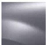
D 69 Grigio Platino